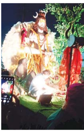
हरिभूमि न्यूज कोतमा।

नगर में महाशिवरात्रि पर्व बड़े ही धूमधाम से मनाया गया। सुबह से ही नगर के शिवालयों में शिव भक्तों की भीड़ उमड़ पड़ी। नगर के ठाकुर बाबा धाम गौरी शंकर मंदिर शिव मंदिर शिव सागर धाम धर्मशाला मंदिर पंचायती मंदिर विकास नगर बनिया टोला शिशु भारती स्कूल के पास नवनिर्मित शंकर मंदिर लहसुई कैंप में स्थित शिव मंदिर में श्रद्धालुओं की भीड़ बाबा भोलेनाथ की पूजन अर्चन करते नजर आए। शिव भक्तों ने भगवान भोलेनाथ को अभिषेक करते हुए बेलपत्र धूप सहित फूल अर्पित किए। सुबह से ही मंदिरों में भगवान भोलेनाथ के जयकारों की गंज लगती रही। नगर के ठाकुर बाबा धाम सहित जगह-जगह शिव भक्तों के द्वारा भंडारे का आयोजन किया गया था जिसका प्रसाद लेने के लिए लोगों की लंबी लाइन लगी रही। नगर के विद्युत मंडल कार्यालय स्थित गौरी शंकर मंदिर से शाम को शिव बारात बाजे ग्राजे के साथ निकाली गई जो नगर की विभिन्न गलियों से होते हुए मंदिर परिसर पहुंचकर समापन किया गया। शिवजी आज दूल्हा बने हैं। देवी पार्वती से विवाह की तैयारी है। गले में नागराज, हाथ में त्रिशूल, माथे पर चांद,शरीर पर भस्म... अद्भुत छटा बिखेरे रहा है भोलेनाथ